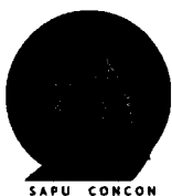
TABLA 4: EXPERIENCIA EN CENTRO DE SALUD FAMILIAR DE LA ATENCION PRIMARIA Y DEPARTAMENTO DE SALUD MUNICIPAL (según corresponda, CES-CECOSF-CESFAM-POSTA RURAL, CGU, CGR, SAPU, SAR, SUR, etc.)