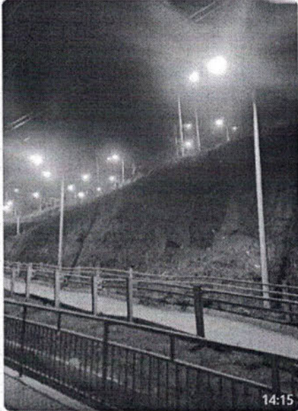
ILUMINACIÓN REPARADA 11-04