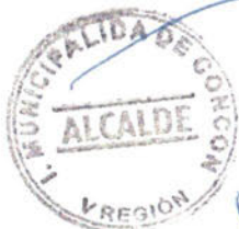
FREDDY RAMIREZ VILLALOBOS ALCALDE MUNICIPALIDAD DE CONCON