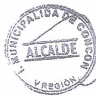
FREDDY RAMIREZ VILLALOBOS ALCALDE I. MUNICIPALIDAD DE CONCON