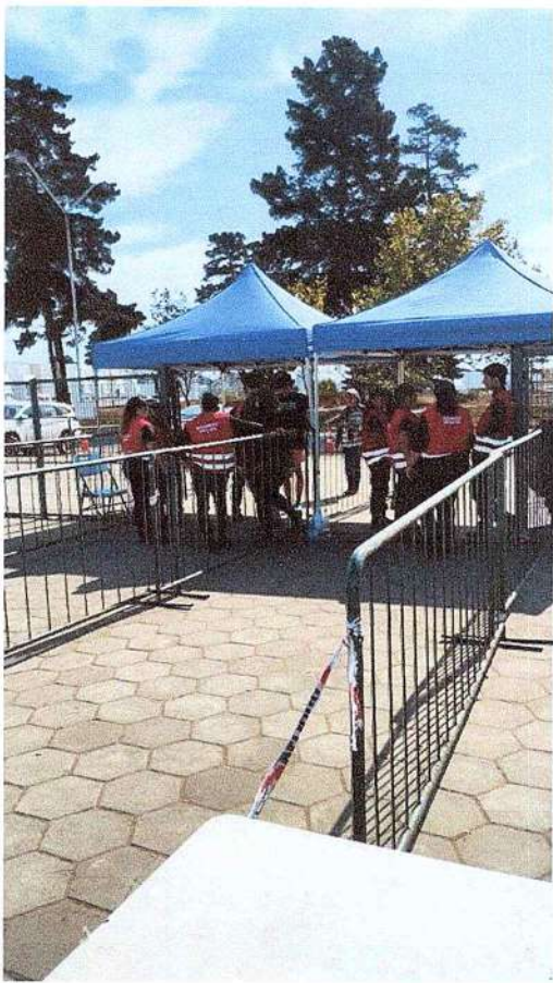
Imágenes 01 de Marzo 2024