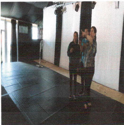
-Reunión en el espacio cultural con Pastores y encargada.