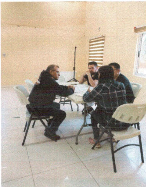
-Reunión de coordinación con jóvenes de la Iglesia de Jesucristo de los Santos de los Últimos días, para coordinar actividades en Febrero.