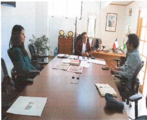
-Audiencia con Pastor(a) de la Iglesia Presbiteriana.