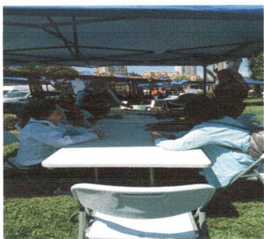
Apoyo en la actividad de la expo lengua materna.