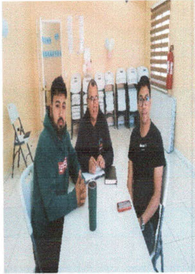
-Reunión de coordinación con Pastores para actividades religiosas