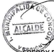
FREDDY RAMIREZ VILLALOBOS ALCALDE I. MUNICIPALIDAD DE CONCON