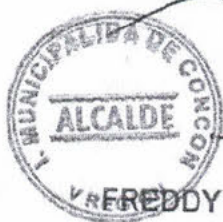
FREDDY RAMIREZ VILLALOBOS ALCALDE I. MUNICIPALIDAD DE CONCÓN