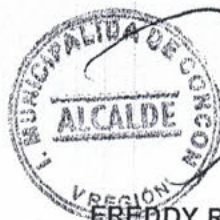
FREDDY RAMIREZ VILLALOBOS ALCALDE I. MUNICIPALIDAD DE CONCON