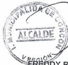
FREDDY RAMIREZ VILLALOBOS ALCALDE I. MUNICIPALIDAD DE CONCON