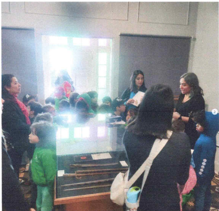
Anexo 4: Recepción Segundo Básico Colegio Los Bosques de Reñaca.