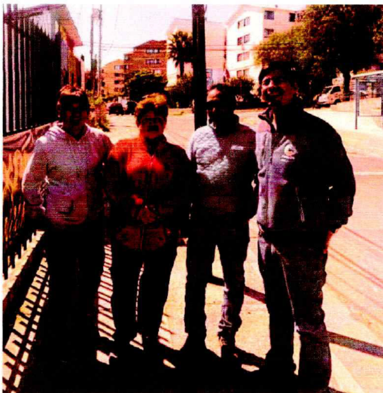
Reunión con JJVV Los Troncos ara definir puntos de instalación de Alarmas SAC