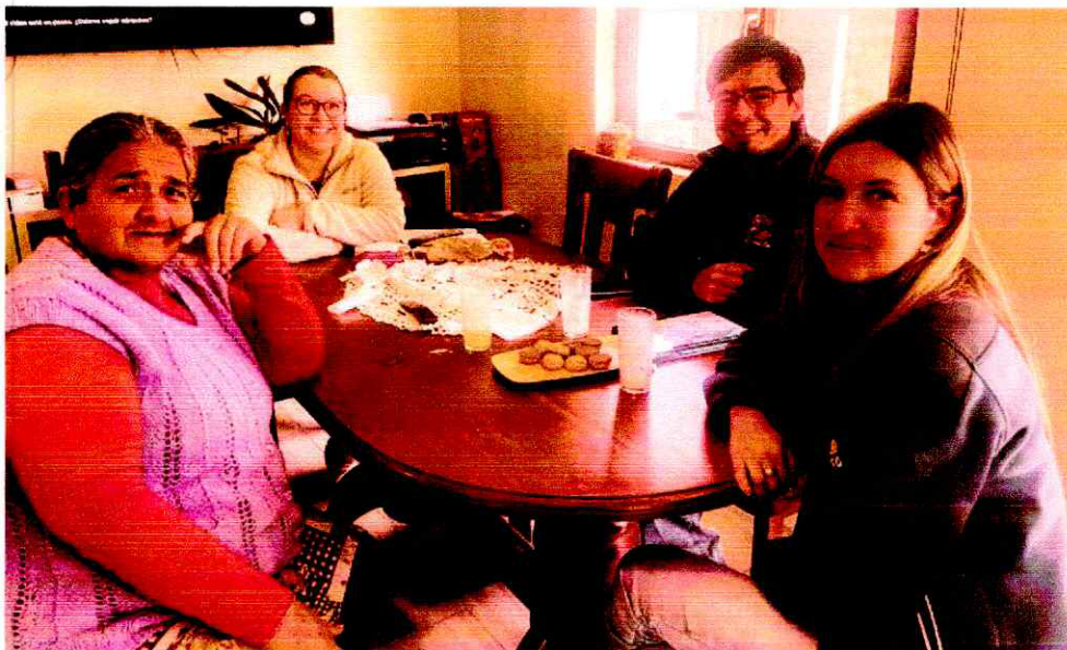
Reunión con JJVV San Andrés ara definir puntos de instalación de Alarmas SAC