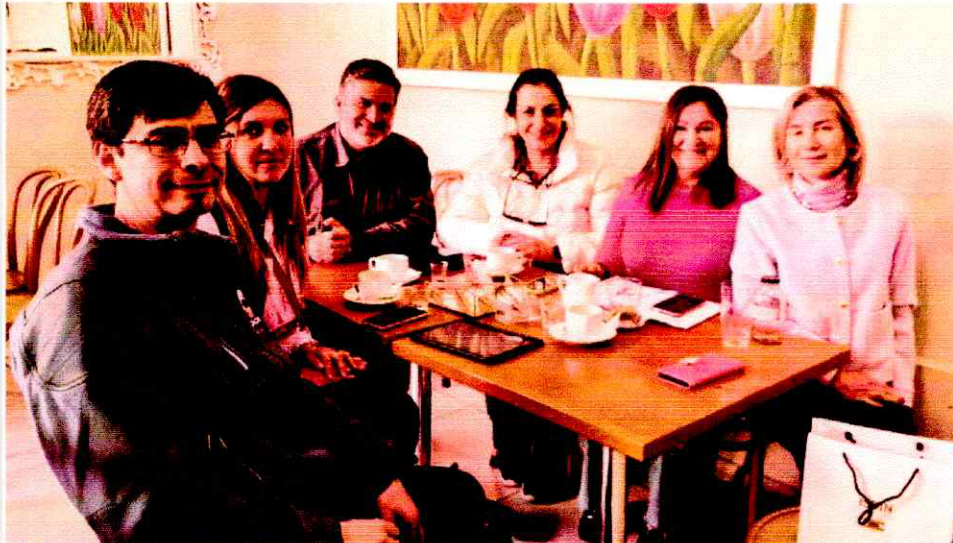
Reunión con JJVV en Bosques de Montemar para planificación de implementación en e sector