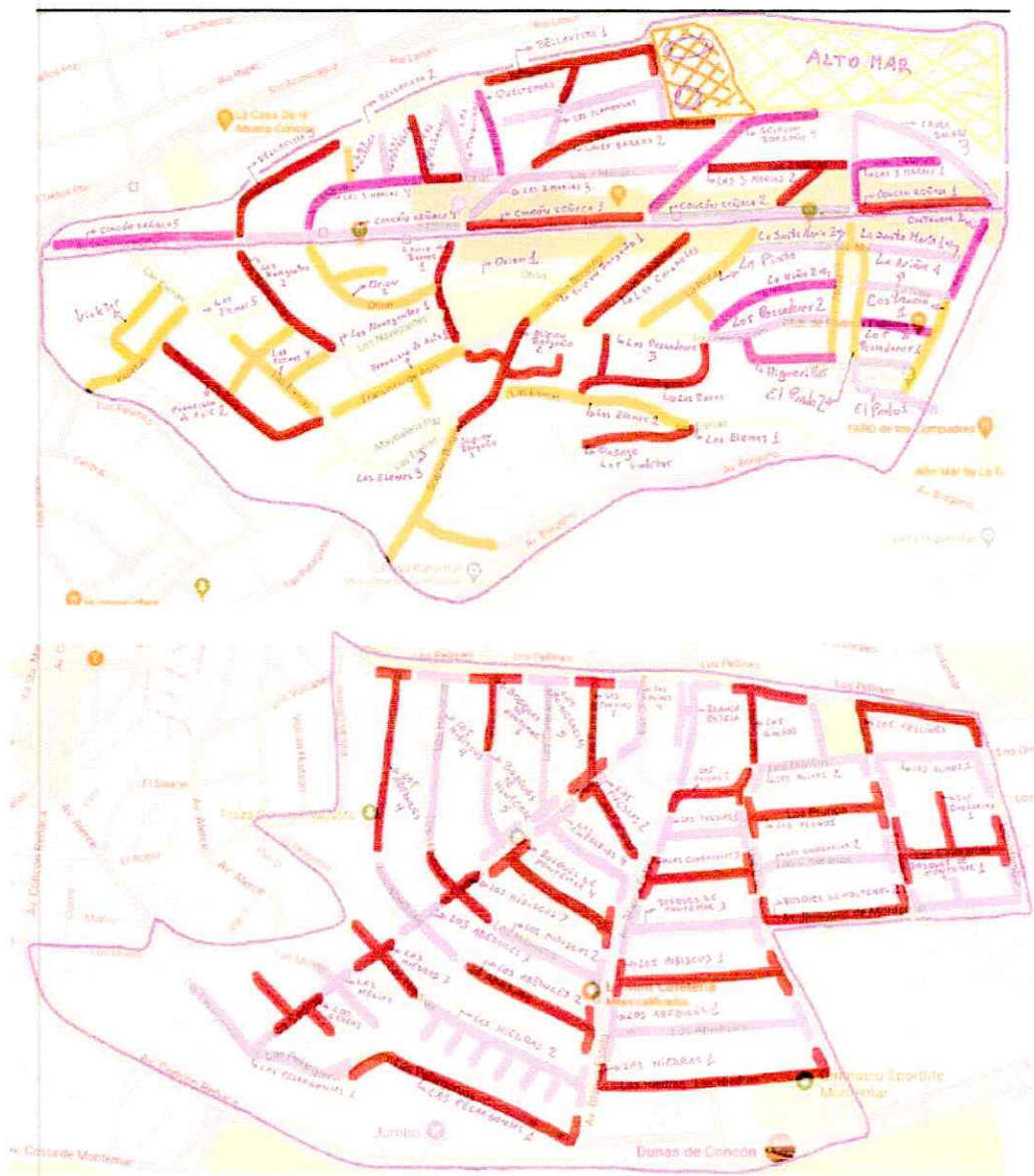
Definición de centrales en Concon Sur y Bosques de Montemas