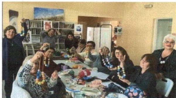
Agrupacion Femenina Tejiendo con amor