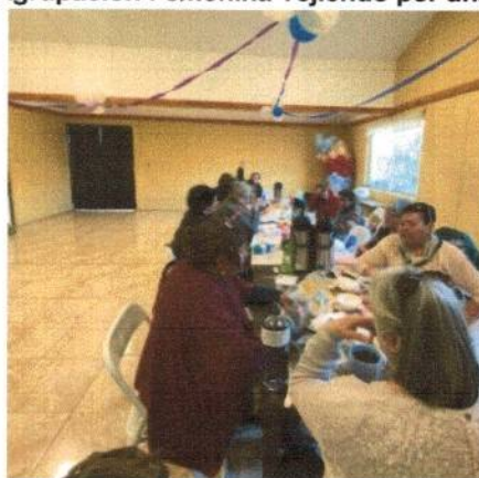
Agrupación Femenina Tejiendo por una sonrisa