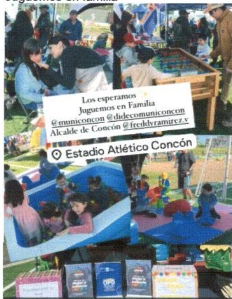
Juguemos en familia