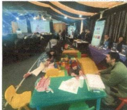
Feria Educativa de la Lactancia Materna