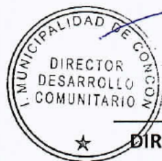
DIRECTOR DIDECO (S)