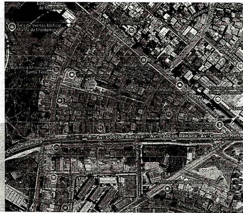
Definición de nuevas Centrales SAC en sectores Porvenir y Vista al Mar