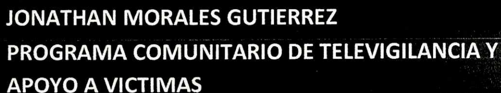
Seguimiento y gestión de solución de alarmas SAC desconectadas