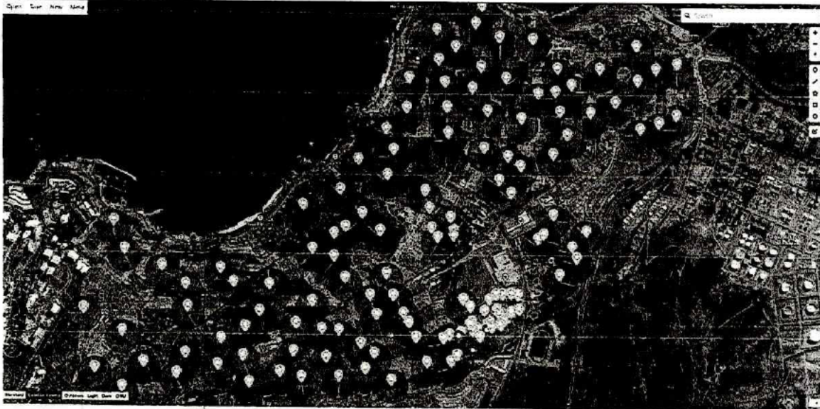
Nuevas Alarmas SAC instaladas en sectores de Desembocadura, Higuerillas y Vista al Mar