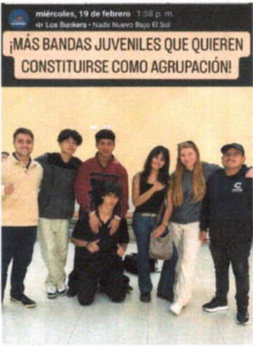
Semana del 24 de febrero al 28 de febrero del 2025