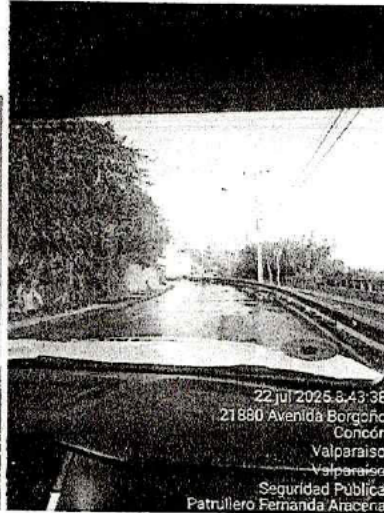
22 jul 2025 8:43:38 21860 Avenida Borgoño Concón Valparaíso Seguridad Pública Patrullero Fernanda Aracena