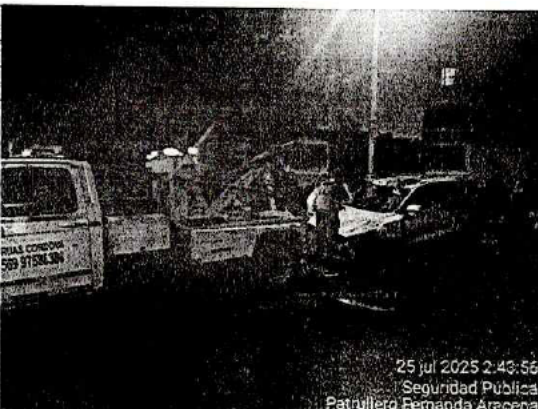
25 jul 2025 2:43:56 Seguridad Pública Patrullero Fernanda Aracena