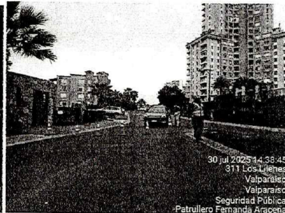
30 jul 2025 14:38:45 311 Los Lirios Valparaíso Seguridad Pública Patrullero Fernanda Aracena