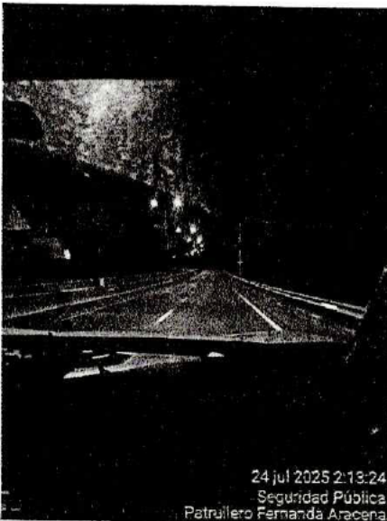
24 jul 2025 2:13:24 Seguridad Pública Patrullero Fernanda Aracena