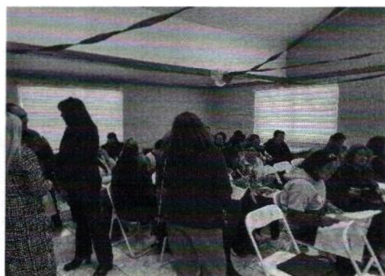
Sede Villa Primavera Martes 22 de Julio de 2025