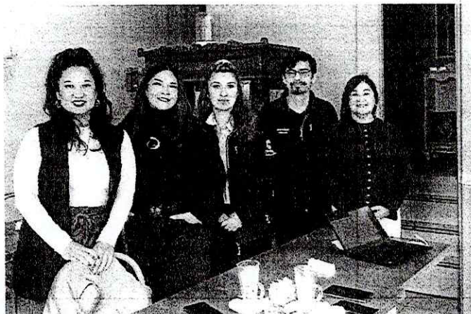
Reunión con propietaria de comercio y Presidenta de JJVV junto a Turismo y Fomento Productivo para tratar temas del proyecto 'Alerta Comercio' e instalación de Alarmas Comunitarias