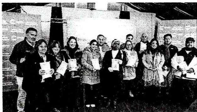
Ceremonia del proyecto 'Alerta Comercio' en la cual se realizó entrega de Botones de Pánico