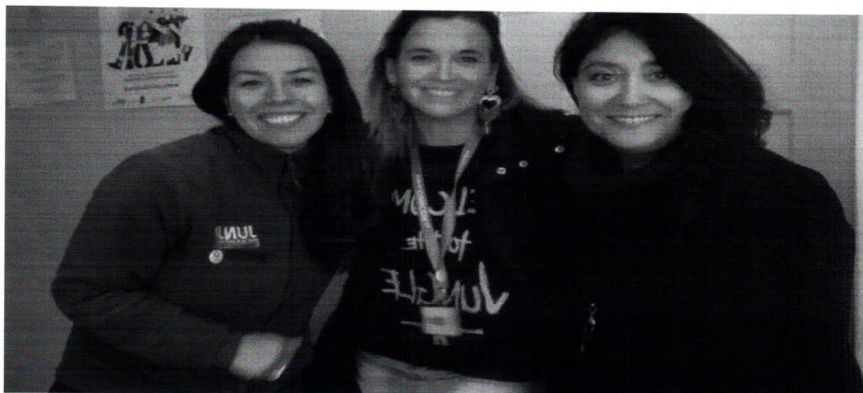
Entrega de reconocimiento a Jardín Gaviota Blanca ( anexo 6).