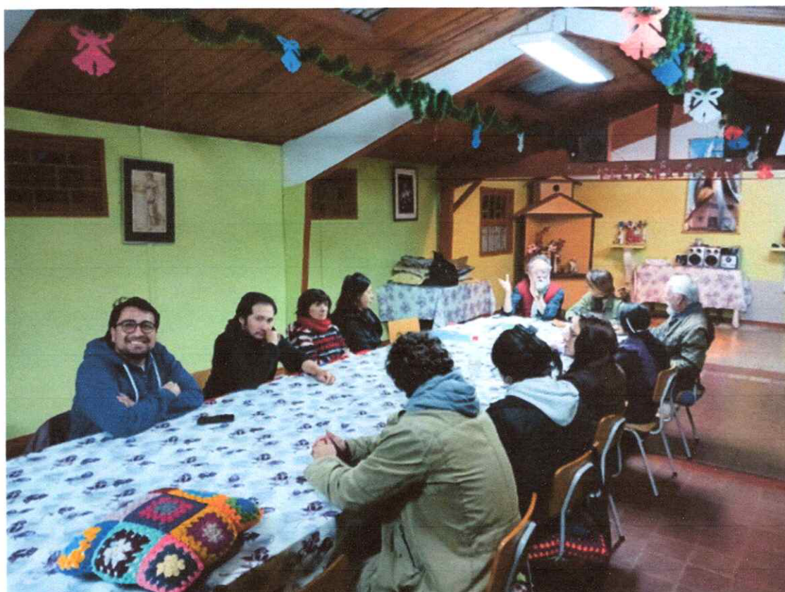
Taller de Proyectos Culturales