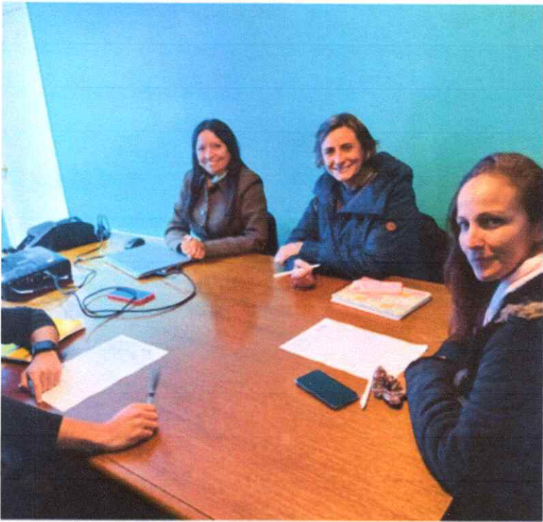
lunes, 12 de mayo de 2025 · 20:12 Editar 20250512_201222.jpg /Almacenamiento interno/DCIM/Camera

alcaldía mie, 14 may, 11:03 a.m. (hace 21 horas) En adjuntos ORD N° 283 CULTURA Con la providencia correspondiente y se ha remitido según distribución FAVOR ACUSAR RECIBO GRACIAS Atte