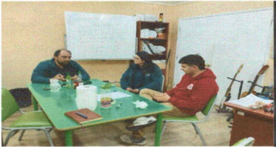
-Reunión con el encargado del Club de Rugby Viña y las Oficinas de Juventud y Discapacidad.