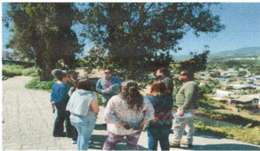
-Visita en terreno al Parque Los Tres Esfuerzos