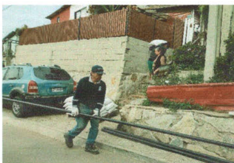
-Apoyo en la entrega de materiales en la Población El Carmen.