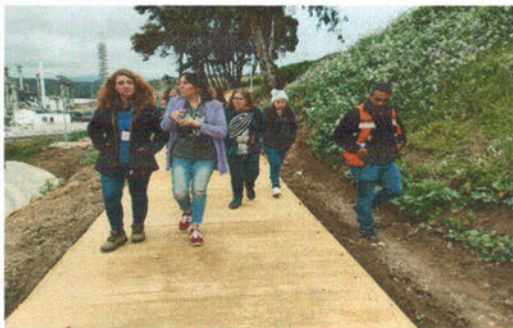
--Visita en terreno con la encargada de proyecto de Serviu y la JJVV Los Tres Esfuerzos.