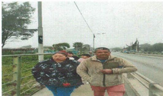
-Simulacro de tsunami en el Sector La Isla.