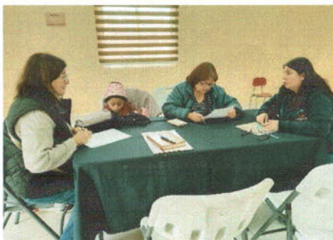
-Reunión con agrupaciones de discapacidad.