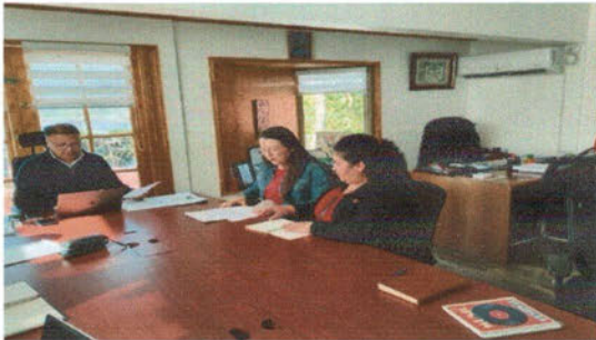
-Audiencia con el Alcalde y la JJVV San Andres.