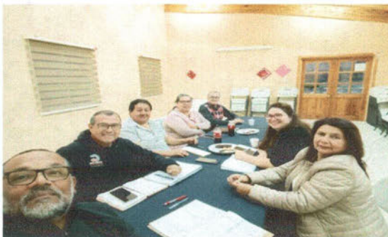
-Reunión con Pastores (as).