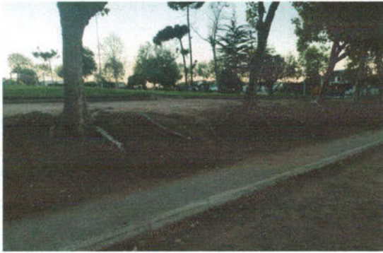
Visita en terreno en la Plaza Laura Barros.