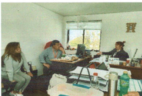
-Reunión con el equipo de Evento y Migrante.