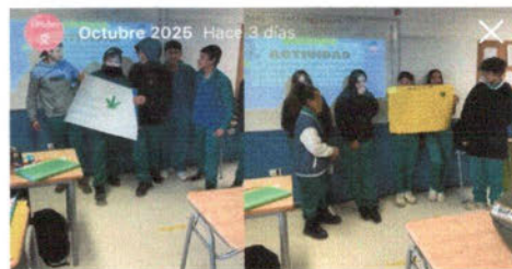
Taller Elige Cuidarte ✨ Alumnos de 7mo básico - Escuela Puente Colmo Profesionales @seguridadpublicaconcon y @meiconcon #municoncon