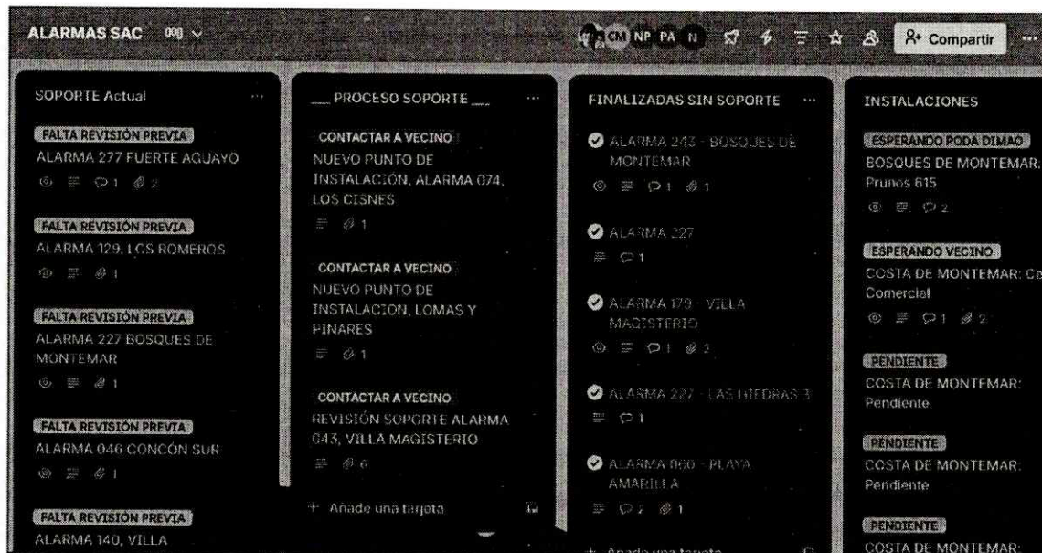
Monitoreo y gestión de soluciones de Alarmas Comunitarias