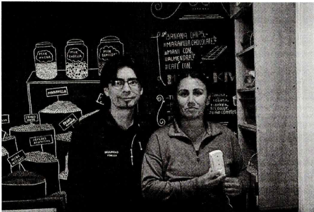
Visita en terreno a beneficiarios del proyecto Alerta Comercio para la entrega de información, capacitación, configuración de botones de pánico y firma de comodato.