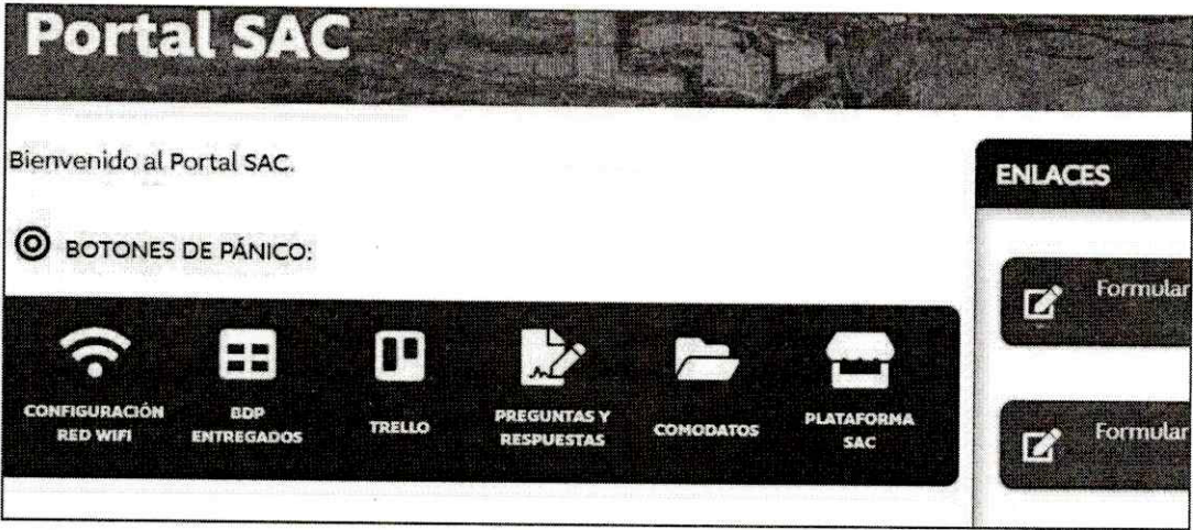
Actualización de accesos y datos para el control de procesos del proyecto Alerta Comercio