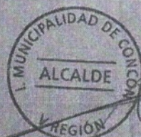
SEBASTIAN TELLO CONTRERAS ALCALDE (S) I. MUNICIPALIDAD DE CONCÓN