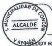
EDDY RAMIREZ VILLALOBOS ALCALDE I. MUNICIPALIDAD DE CONCÓN