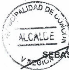
SEBASTIAN TELLO CONTRERAS ALCALDE (S) I. MUNICIPALIDAD DE CONCÓN