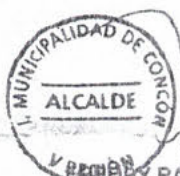
YRENNY RAMIREZ VILLALOBOS ALCALDE I. MUNICIPALIDAD DE CONCÓN