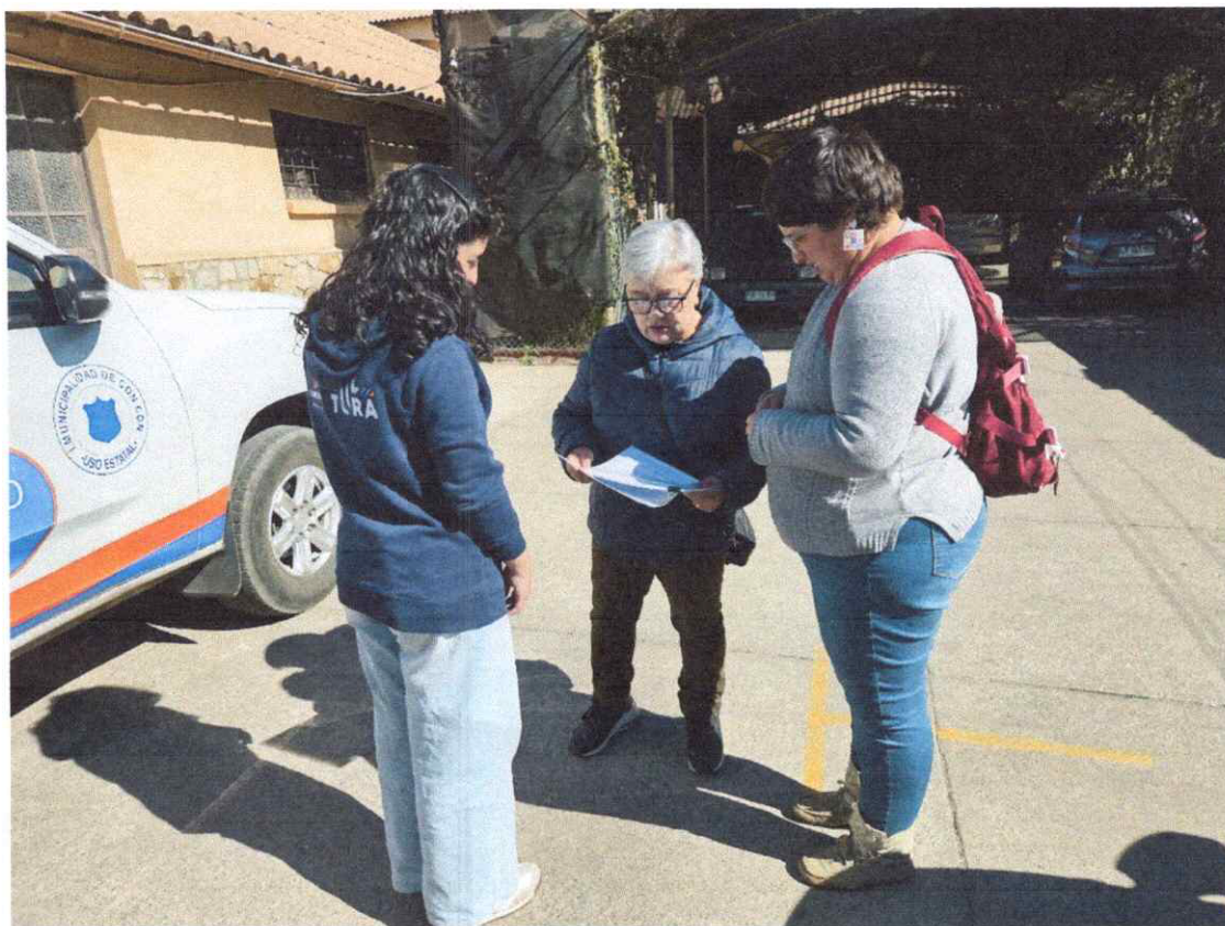
Anexo 12: Entrega de objetos patrimoniales a la Parroquia de Concón