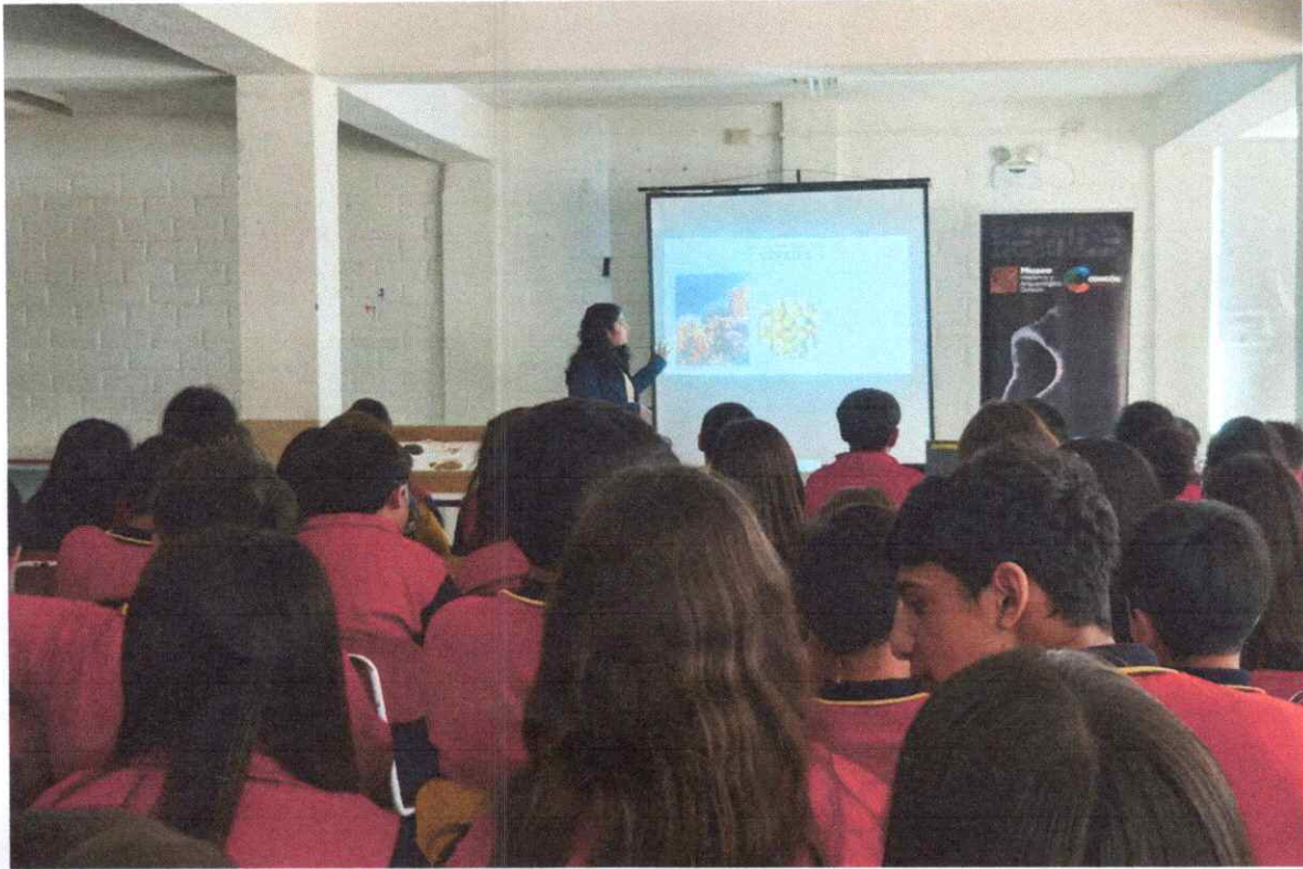
Anexo 8: Exposición y Charla en Sede Los Tres Esfuerzos