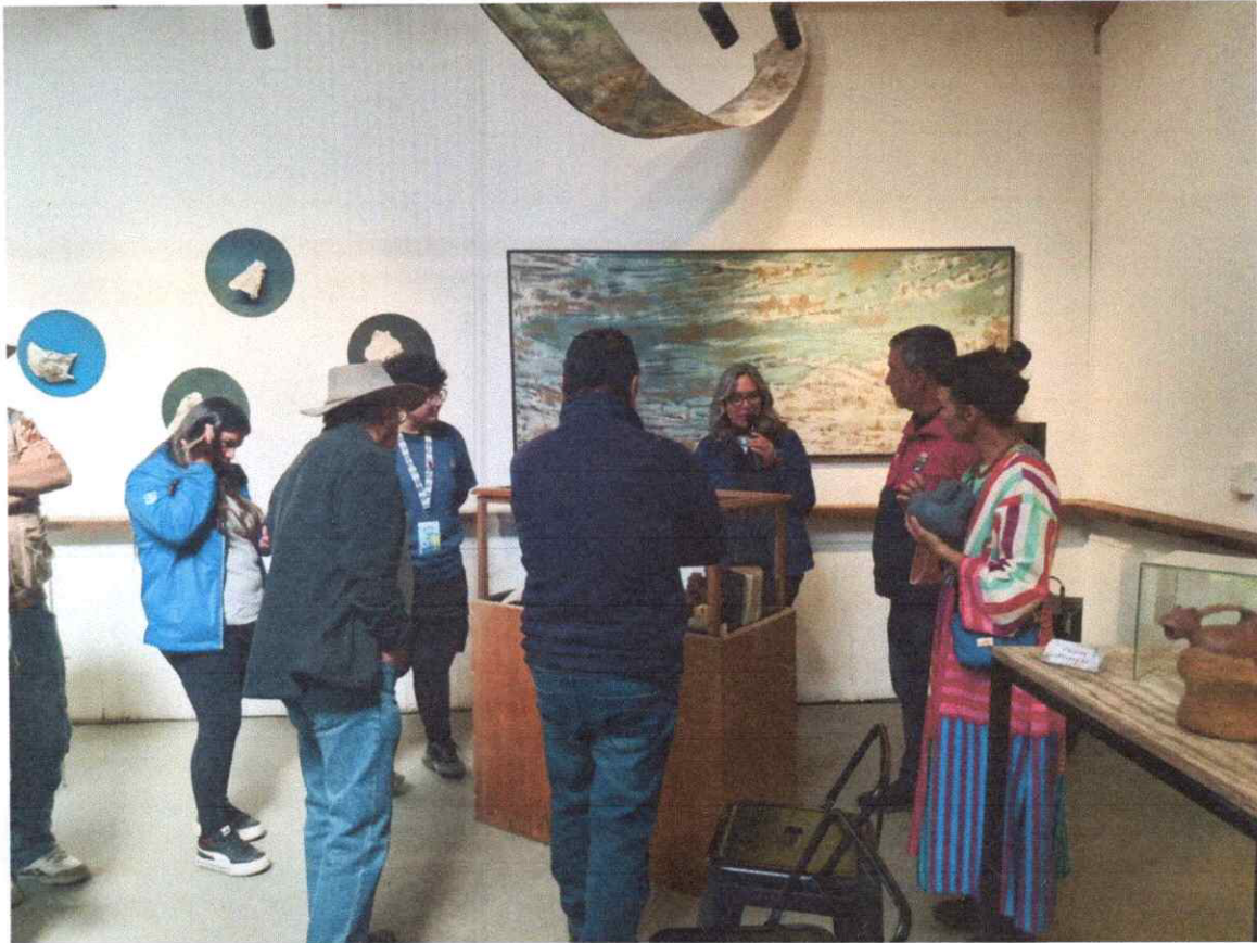
Anexo 10: Participación en Festival Ola!