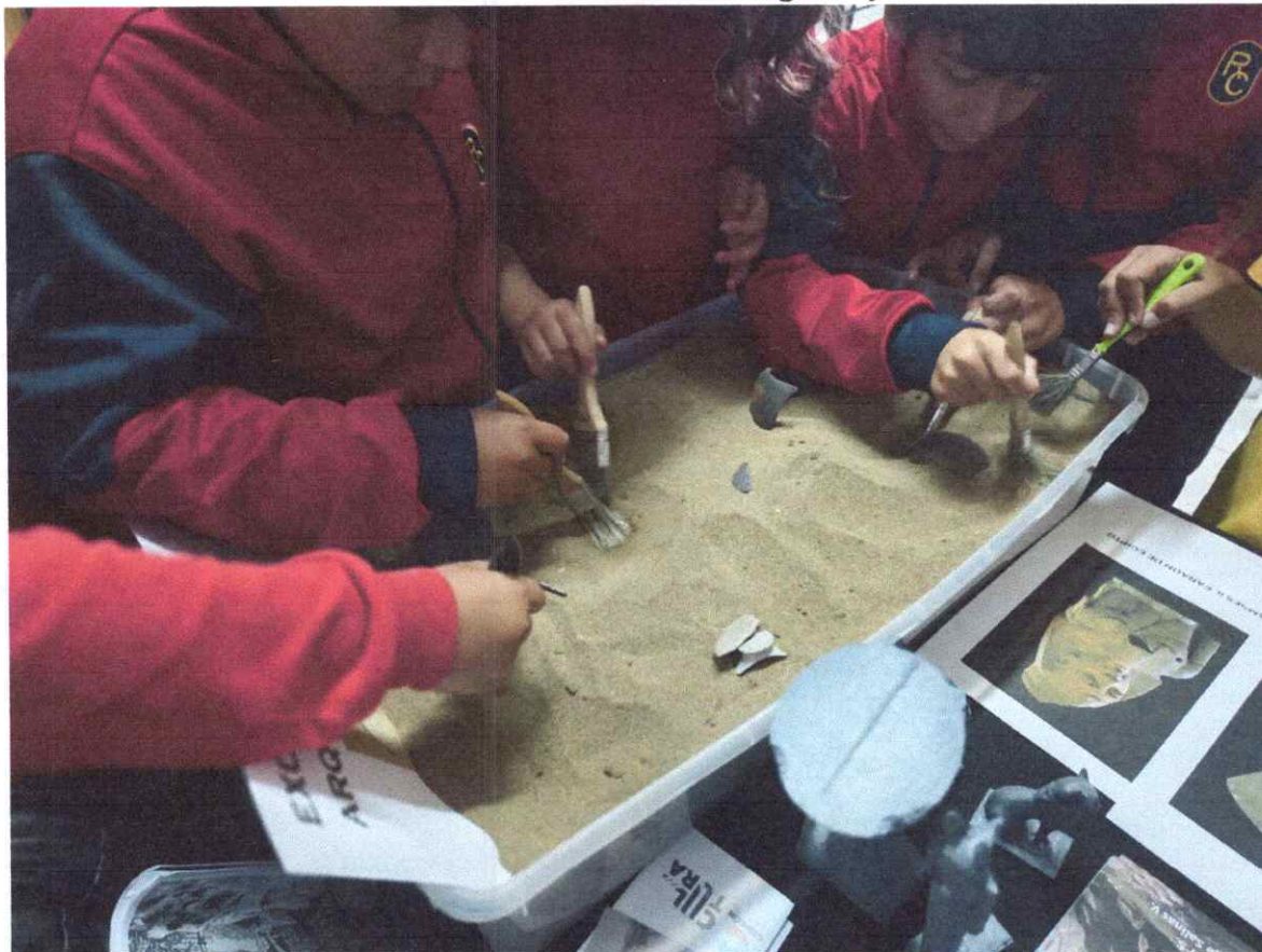
Anexo 2: Invitación a XV Encuentro de Museos de la Región de Valparaíso