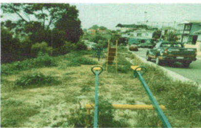
-Visita en terreno sector Caleta Higuierillas.