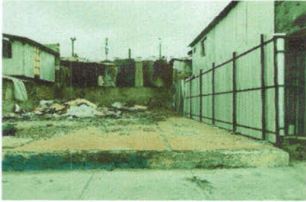
-Visita en terreno, lugar del incendio, Población Los Tres Esfuerzos.