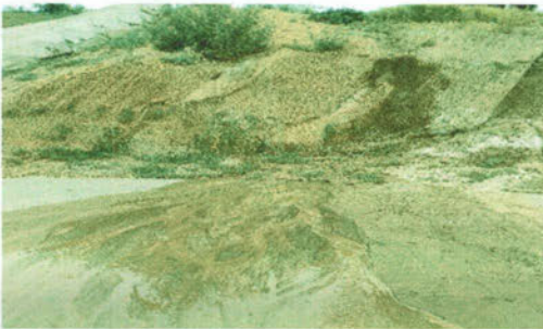
-Visita en terreno en el sector el Parque las Palmeras, por rotura de cañería.