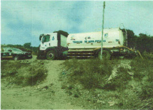
-Apoyo a las trabajadoras sociales en el Sector La Isla, por amago de incendio.