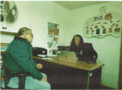
-Reunión con la encargada del Parque Humedal.