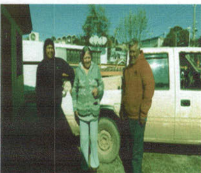
-Entrega de ropa por parte de la Capilla Santa Teresa de Caleta Higuierillas a persona del Sector La Isla afectada por un incendio.