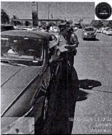
18-03-2026 13:12:32 Concón Valparaíso