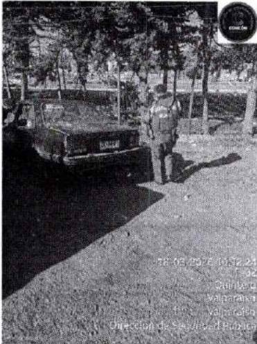
18-03-2026 10:12:21 Concón Valparaíso Dirección de Seguridad Pública