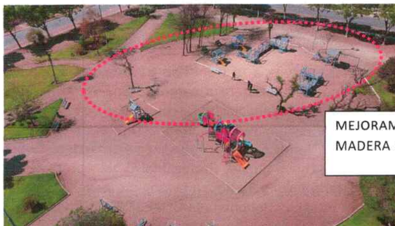
MEJORAMIENTO DE JUEGOS DE MADERA EXISTENTE